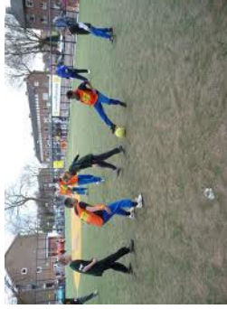
Het Cruiff Court.

Uitnodiging voor de opening van de TENTOONSTELLING